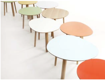
*original habitek works